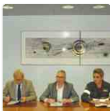
27 luglio 2016 Nelle Marche una maggiore prevenzione contro gli incendi