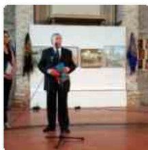
16 agosto 2016 Manifestazione di amicizia italo-russa in nome dell'arte