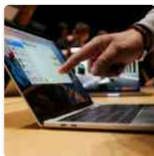
24 gennaio 2017 Nelle Marche continua il preoccupante calo dei lavoratori pubblici