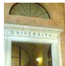
Un'altra eccellenza delle Marche: l'Università di Macerata seconda in Italia per qualità di